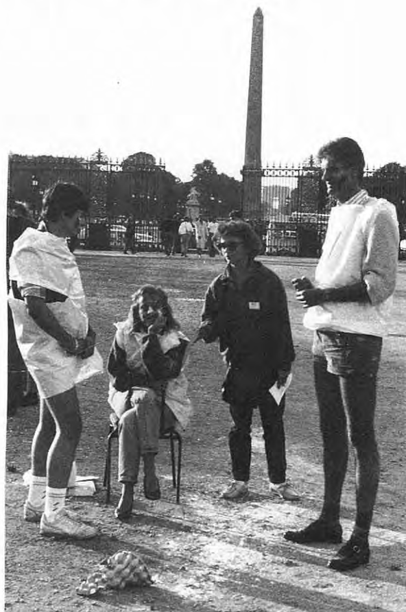
Un THAILLEZ - Deux MOUILLET

Rendez-vous aux Tuileries pour l'assaut final : P20 contre P21! Que les meilleurs gagnent. Mais le combat est truqué : les P20 sont armés (farine, oeufs...)