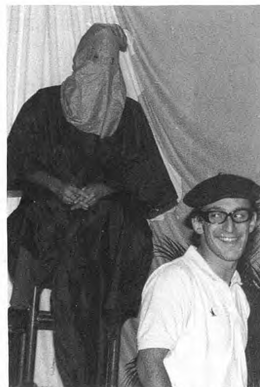
Sous le regard "transpersant" du Grand ZORG le Président de la J.E a repéré sa future proie.